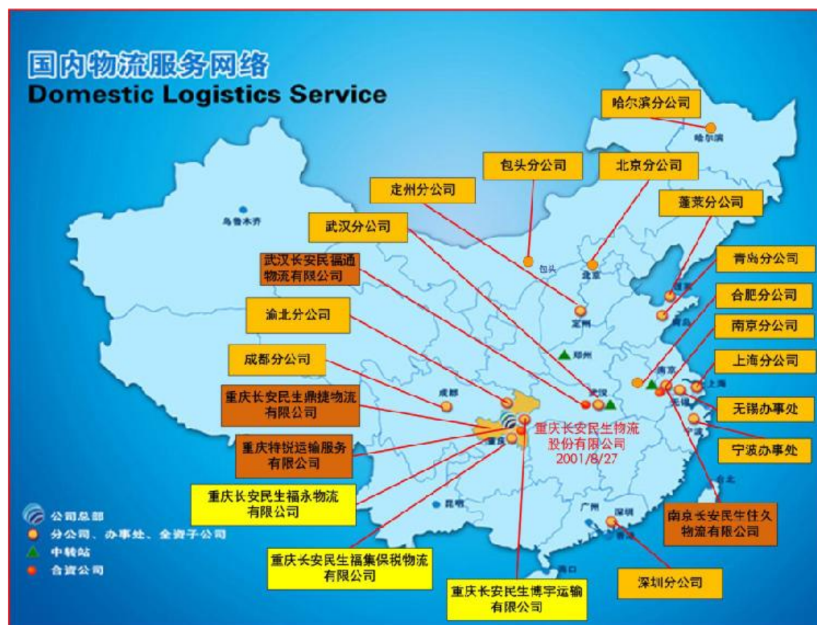
圖二：公司目前的分支機構分佈圖

為完善並擴大服務網路，提高服務能力，本公司強化了分支機構的建設，並通過有效利用資訊技術系統的手段對各分支機構實施科學管理。截至 2012 年 12 月 31 日止，本公司累計建立分公司、子公司、聯營企業和辦事處 22 個，主要分佈在華東、華中、華北、華南和西南地區（圖二）。不斷完善的服務網路，令本集團能提供物流服務至全國各地。